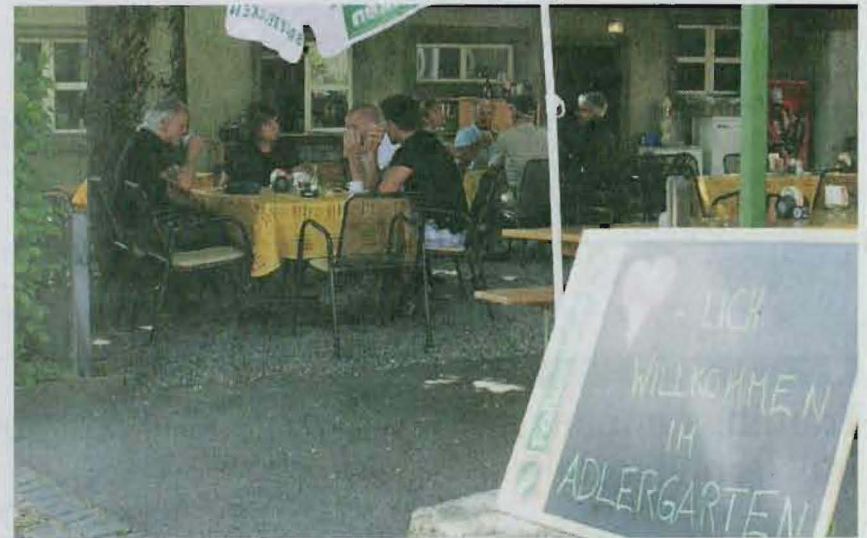
Das Restaurant Adler lud im Garten unter die schattenspendenden Bäume ein.