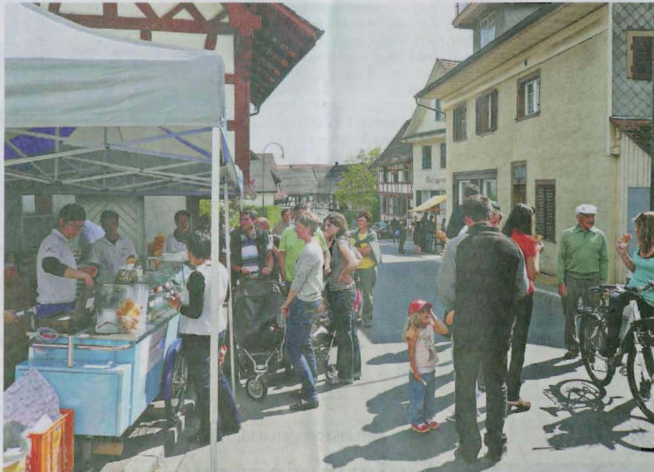
Beim Beck gabs auch Glace: Die Leute in der Schlange warteten darauf, bis sie sich am Eisbuffet der Bäckerei Ammann ihre Liebblingssorten in ein Waffelcornet pappen lassen konnten.

Das vergangene Wochenende war prall: Überall wurde gefeiert, ausgestellt, degustiert und präsentiert. So auch in Unterstammheim, wo das Gewerbe mit seinen offenen Türen der Bevölkerung Einblick in seine Arbeit und Produkte gab. Doch die vielen Veranstaltungen in der Region machten dem Gewerberundgang Konkurrenz. Am Samstag waren nur sehr wenige Leute in der Sennegasse unterwegs, am Sonntag etwas mehr, aber nie wie in den letzten Jahren. Doch so konnten sich die Aussteller mehr Zeit nehmen für ihre treuesten Kunden, Freunde und Bekannten. Wenn auch die Strassen nicht überfüllt waren: Die Beizli und zahlreichen Festgarnituren waren begehrte Plätze, und die Leute genossen es, bei herrlichem Wetter ein paar Stunden in bester Gesellschaft zu verweilen. (ul)