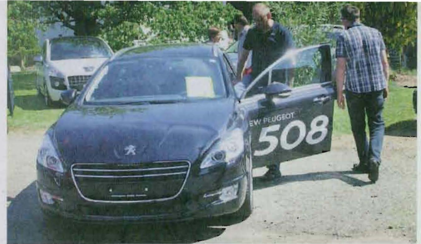
Auf ans Steuer des neuen Peugeot 508 Kombi bei der Weinberggarage Hug.