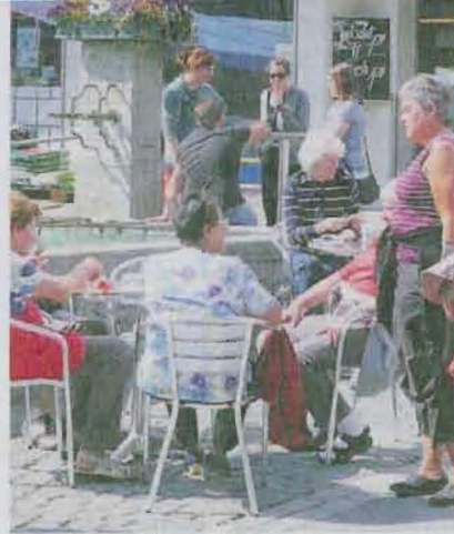
Die Festwirtschaft beim Volg.