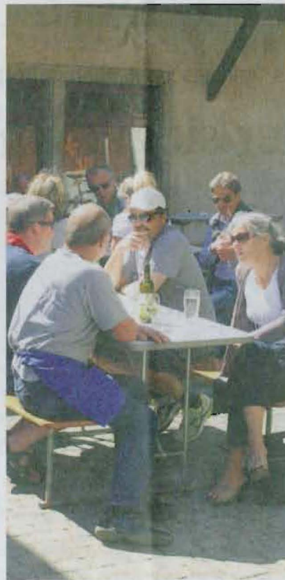
Gemütliches Zusammensein bei der Metzgerei Frei und dem Pistolenclub.