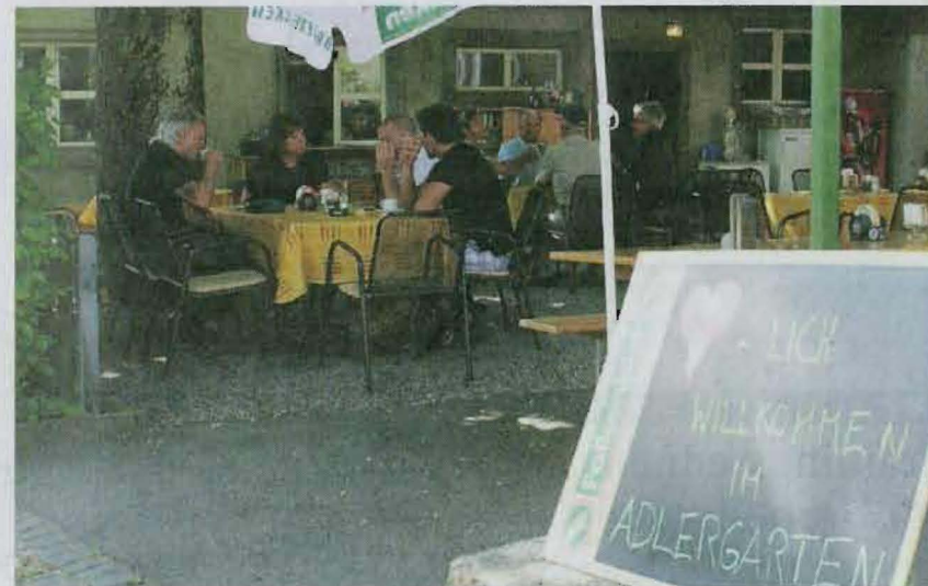
Das Restaurant Adler lud im Garten unter die schattenspendenden Bäume ein.