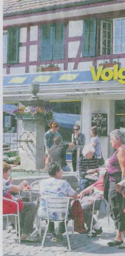
Die Festwirtschaft beim Volg.