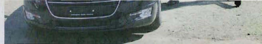
Auf ans Steuer des neuen Peugeot 508 Kombi bei der Weinberggarage Hug.